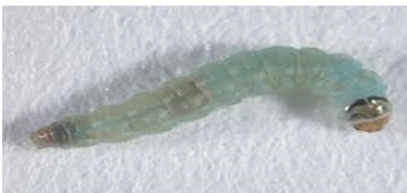
Լուլիկի ցեցի տարբեր հասակի թրթուրներ

Թիթեռը ձվադրում է տերևների վրա (հիմնականում ստորին կողմում), ծաղկակոկոնների, կանաչ պտղաբաժակի, բույսի վերգետնյա այլ օրգանների վրա: