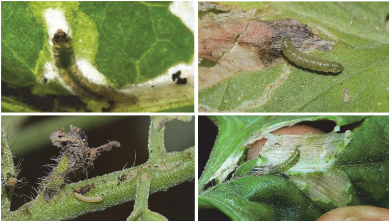
Ցեցի թրթուրներ և վնասված տերևներ

Լուլիկի հարավամերիկյան ցեցը տարածվում է զարգացման բոլոր փուլերում, հիմնականում՝ թրթուրային փուլում, ներմուծվող պտուղների և տնկանյութի, ինչպես նաև փաթեթավորման նյութերի միջոցով: Թիթեռները լավ են թռչում և քամու հոսանքով կարող են տարածվել մեծ հեռավորությունների վրա: Պոտենցիալ վտանգ են ներկայացնում նաև դեկորատիվ մորմազգի բույսերը, բուսական սուբստրատը և տարաները: