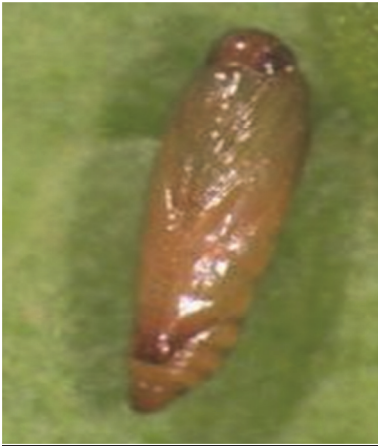
Լուլիկի ցեցի հարսնյակ

Հասուն ցեցն ակտիվ է արևի մայր մտնելուց հետո և լուսաբացին, իսկ ցերեկային ժամերին այն պաստպարվում է տերևների արանքում, և կարելի է նկատել միայն բույսը թափահարելիս: Թիթեռները չեն սնվում, սակայն կարող են ապրել մինչև 10 օր: