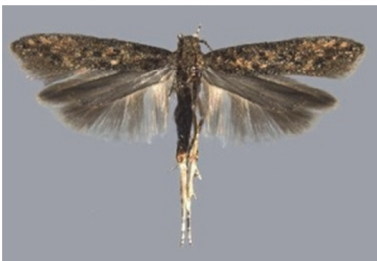
Լուիկի ցեցի թիթեռ