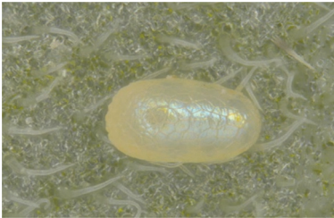
Լուլիկի ցեցի ձու